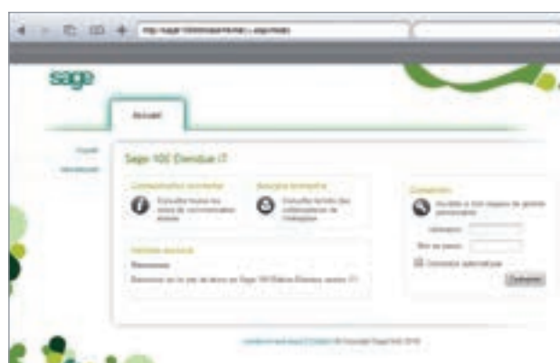
Sage 100 Enterprise Etendue i7 sur iPad®